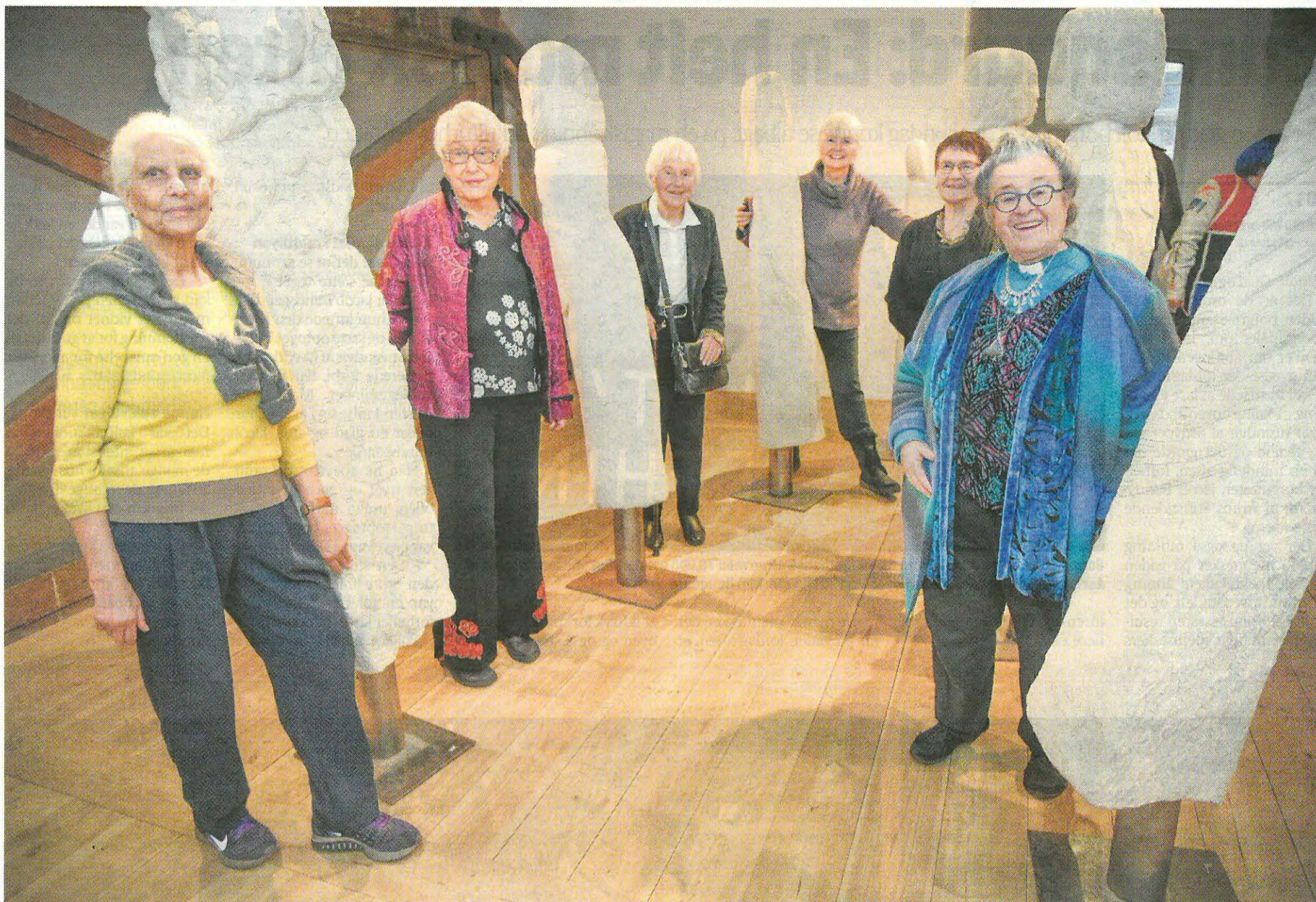
Udstillingen "Mit skib er ladet med minder" omfatter 18 galionsfigurer skabt ud fra 18 kvinder, der også medvirker i en bog, hvor de fortæller om deres liv. En del af kvinderne deltog i ferniseringen søndag.