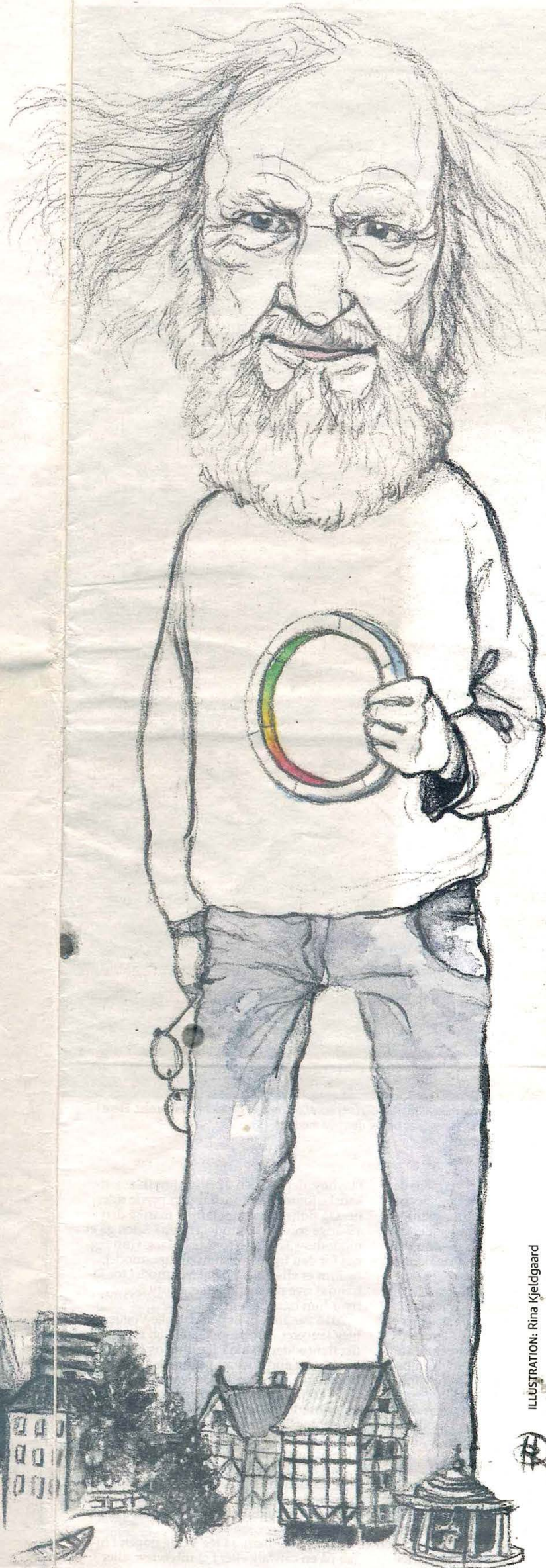
ILLUSTRATION: Rina Kjeldgaard

Døden er dog ikke altid endelig - selv om man er død, kan man stadig stå foran et langt ægteskab, og fortællingen har det med at overvinde døden, så de afdøde kan fortælles videre på nye måder.