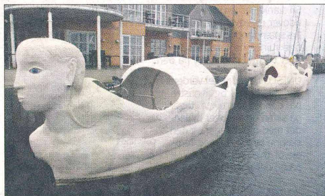
"Mit skib er ladet med længsel" og "Mit skib er ladet med liv", to fartøjer i ferroncement fortøjet i Marselisborg Lystbådehavn.