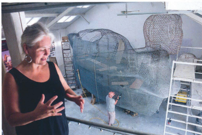
Snart klar for støping; slik er rammeverket på Life-boats nummer 3.